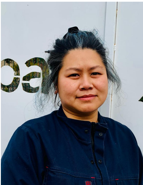
Trophée Régional Pluri'ELLE